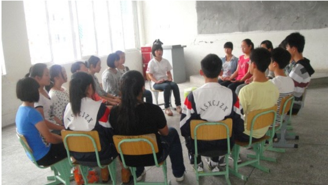
初级中学的考前减压活动